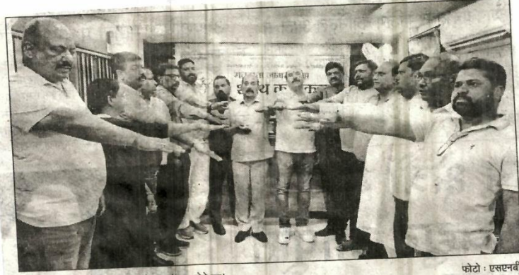
व्यापारी सम्मेलन में मतदान करने का संकल्प लेते हुए।

समाचार पत्र का नाम दैनिक राष्ट्रीय सहारा, लखनऊ दिनांक 08 APR 2024