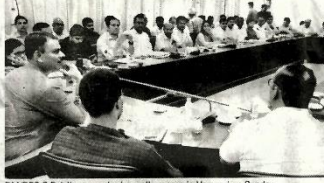
DM/DEO S Rajalingam reviewing poll process in Varanasi on Sunday.

He directed the officers to prepare mapping of vulnerable polling stations and list of vulnerable and critical booths. During the meeting, preparation of EVMs and its randomisation, preparation along with the action plan for training of election related EVMs and personnel, preparation along with the action plan for vote counting, proper training of personnel engaged in elec-